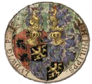
Wappen Pfalzgraf Philipp Ludwigs aus der Karte des Landgerichts Burglengenfeld von 1600 (BayHStA, Pl. 3601).