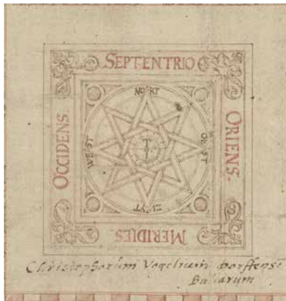
Kartusche aus der Hauptkarte des Pfleg- und Fischmeisteramts Schwandorf, 1600 (BayHStA, Pl. 3716)