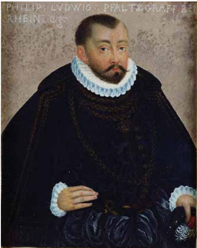
Pfalzgraf Philipp Ludwig, Porträt um 1595 (Miniatur, 6,8 x 5,5 cm, unbekannter Miniaturist des braunschweig-lüneburgischen Hofes; Royal Collection Trust, London, RCIN 420672; http://upload.wikimedia.org/wikipedia/commons/5/54/Philipp_Ludwig_von_Pfalz-Neuburg.JPG )

deutschsprachigen Raum zu jener Zeit zunehmend auch Karten erstellt. 6 Die pfalz-neuburgische Landesaufnahme steht somit in einer Reihe mit anderen bekannten herrschaftlich veranlassten Landeserfassungen im Heiligen Römischen Reich Deutscher Nation, wie sie zeitgleich für die Landgrafschaft Hessen, das Fürstentum Lüneburg, das Herzogtum Pommern, das Kurfürstentum Trier und nicht zuletzt für das Kurfürstentum Sachsen bekannt sind. 7