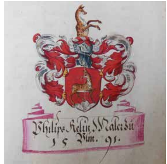
Wappen Philipp Relins (Relin), 1591 von Pfalzgraf Philipp Ludwig verliehen (Archiv des Historischen Vereins Neuburg, Inv. Nr. 1507, fol. 80r)

1967 schrieb Josef Heider: „Die Karten der pfalz-neuburgischen Landesaufnahmen von 1580 bis 1604 erscheinen wegweisend als ausgezeichnete Vorbilder der viel späteren topographischen Landesaufnahmen des 19. Jahrhunderts