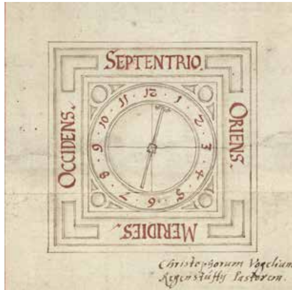
Kartusche aus der Hauptkarte des Pflegamts Hohenburg, 1600 (BayHStA, Pl. 3693)