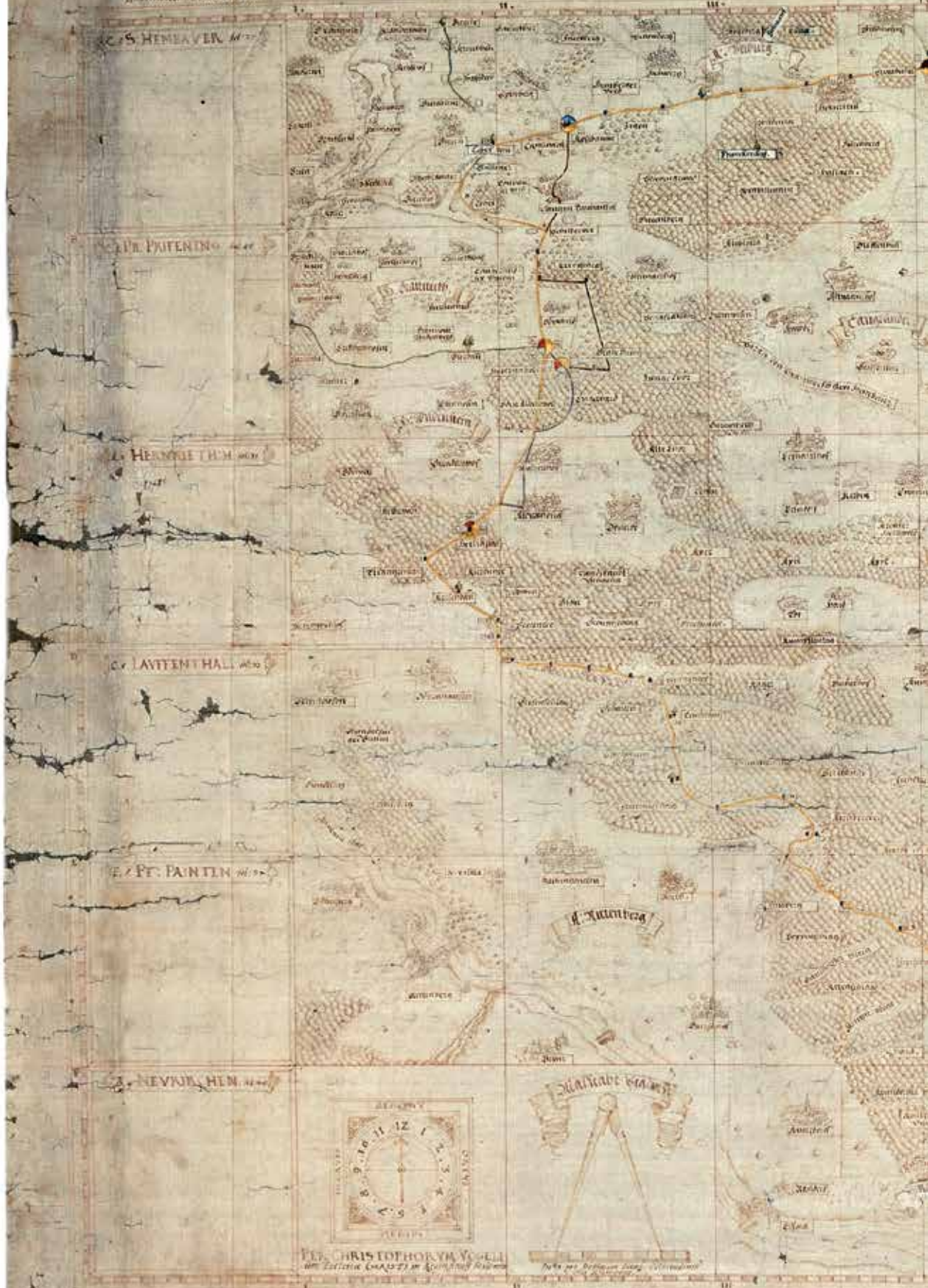
Hauptkarte des Pflegamts Hemau von Christoph Vogel und Matthäus Stang, 1598, Originalgröße 65,5 x 75,8 cm, Papier auf Leinwand, Federzeichnung in Sepia (BayHStA, Pl. 3685)