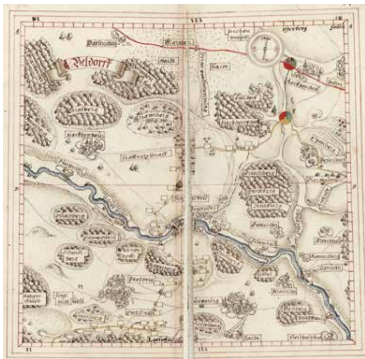
Teilkarte 2 aus dem Libell zum Pflagamt Lupburg von Vogel und Stang, 1600 (BayHStA, Pl. 3597-2).