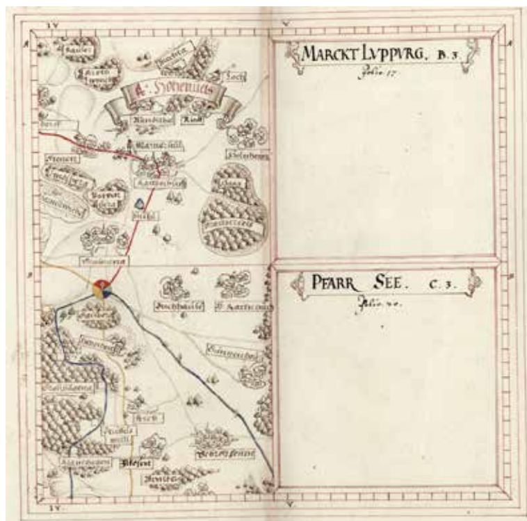
Teilkarte 3 aus dem Libell zum Pflagamt Lupburg von Vogel und Stang, 1600 (BayHStA, Pl. 3597-3).

Nachfolgende Seiten: Hauptkarte zum Pflagamt Lupburg, Kopie von Carl von Flad, 2. Hälfte 18. Jhd., Originalgröße 33,3 x 55,2 cm, Papier, Federzeichnung, koloriert, signiert (BayHStA, Pl. 3473).