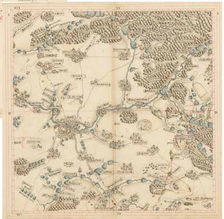
Teilkarte 9 des Libells zum Pflegamt Flossenbürg von Vogel und Stang, 1600 (BayHStA, Pl. 21502-9)