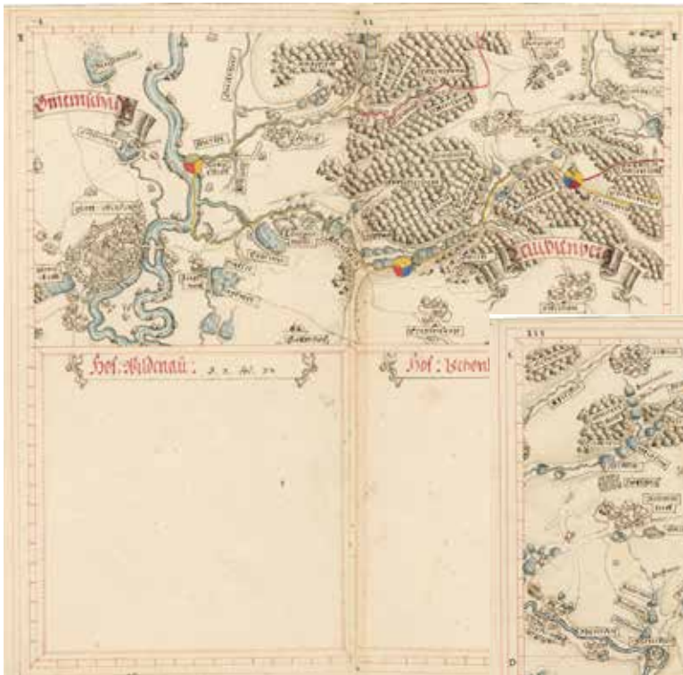
Teilkarte 5 des Libells zum Pflegamt Flossenbürg von Vogel und Stang, 1600 (BayHStA, Pl. 21502-5)