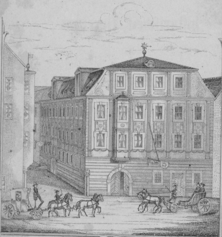
Das ehemalige Gasthaus zum weissen Lamm in Regensburg (1786)