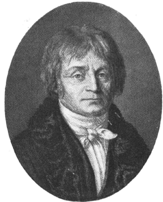
Josef von Görres