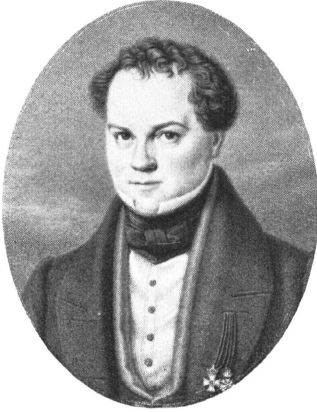
Eduard von Schenk