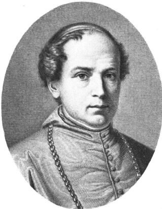
Melchior von Diepenbrock