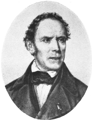
J. Andreas Schmeller