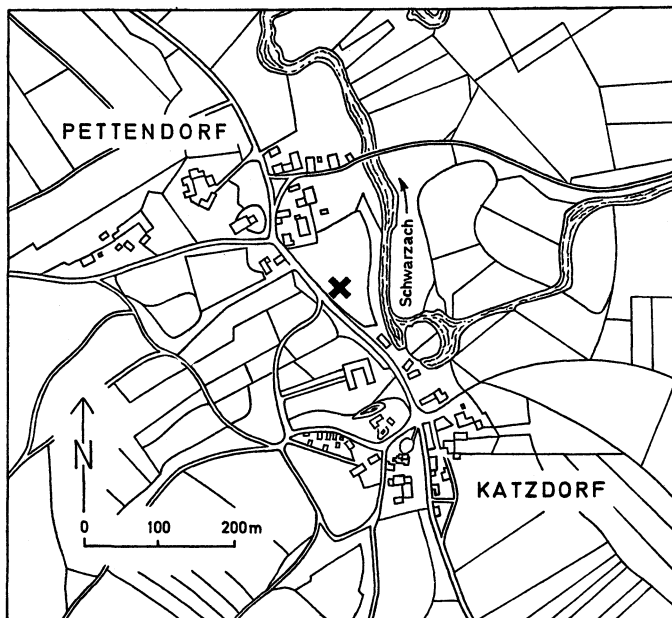
Abb. 1. Pettendorf, Gde. Mitteraschau, Ldkr. Neunburg v. W. Fundstelle (X) der frühlatènezeitlichen Graphittonscherbe. M. 1 : 10 000

latènezeitlicher Graphittonkeramik finden sich in Südböhmen in Modlešovice, Kreis Strakonice 4 .