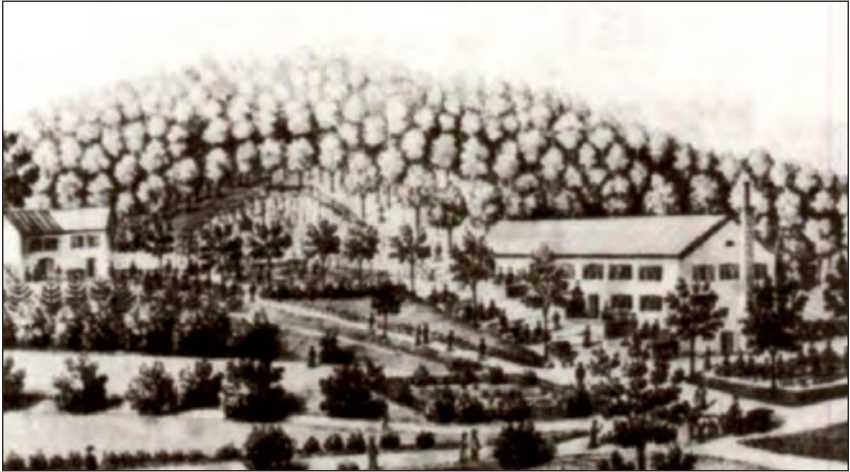
Abb. 5: Stich 19. Jhdt, links Sommerhaus, rechts Hauptgebäude