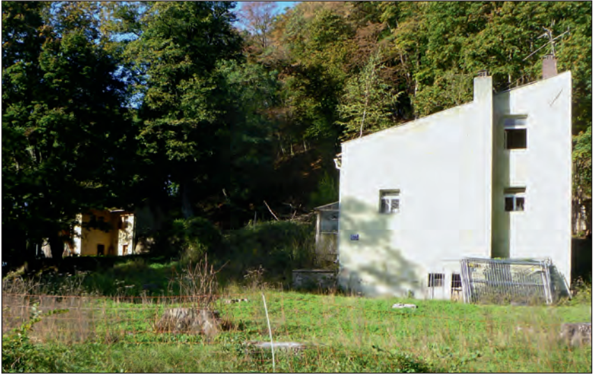
Abb. 12: Der Sommerkeller im Jahr 2018, links das Sommerhaus, rechts das Hauptgebäude