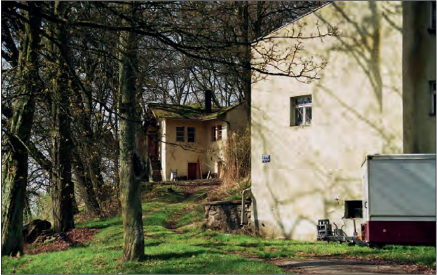
Abb. 11: Der Sommerkeller im Jahr 2008. Im Bildhintergrund das ehemalige Sommerhaus. Im Bildvordergrund (rechts) der Rest des Hauptgebäudes. Ein Teil des Hautgebäudes wurde am 9. Dezember 1944 durch einen Bombenangriff zerstört. Ein Zeitzünder durchschlug zunächst das Dach des ehemaligen Saals. Als der Zeitzünder explodierte wurde auch das gut gebaute Kellergewölbe zerstört. 42 Das Gebäude wurde nicht mehr vollständig aufgebaut.