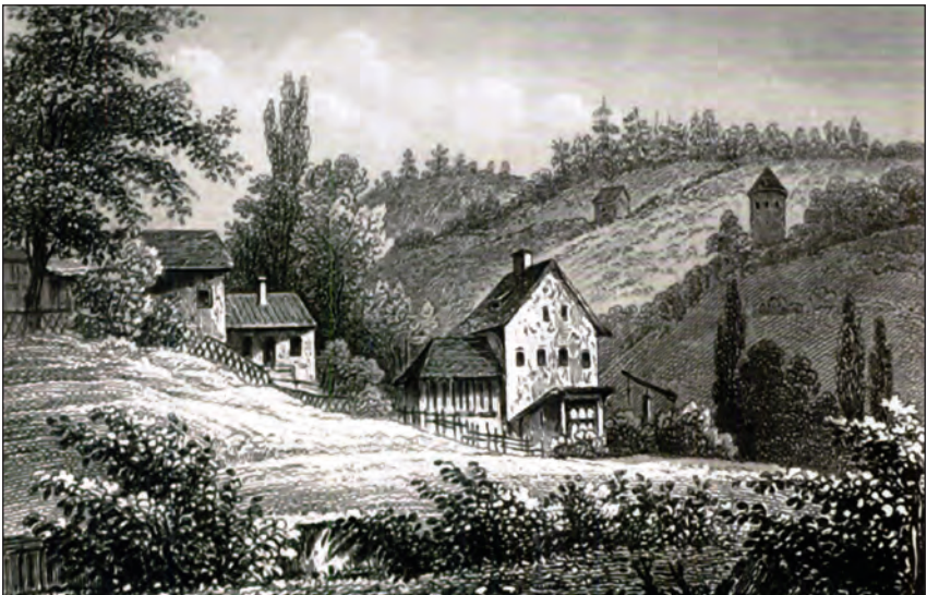
Abb. 2: Links das Hauptgebäude des Sommerkellers, Bildmitte unbekanntes Gebäude, Stich um 1845