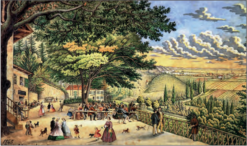
Abb. 7: Links das Sommerhaus, im Hintergrund (Mitte) das Hauptgebäude, rechts im Hintergrund ist der Mittelberg zu erkennen, unterhalb des Mittelberges schlängelt sich ein Feldweg nach Tegernheim, dieser Feldweg ist die heutige Tegernheimer Kellerstraße (Georg Weidmann, 1865)

In einem Erinnerungsbuch über das Sängerefest ist zu lesen: Die Weinstöcke dufteten von den nahen Donauegeländen herüber, und allbereits winkte das Kellerhaus von Tegernheim von der Höhe herab zwischen den langbeinigen Pappeln durch, die am Fuße des Hügels wie eine Festgarde aufgestellt waren. 17