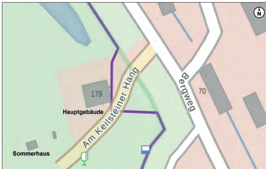
Abb. 10: Lage der beiden Gebäude des ehemaligen Sommerkellers