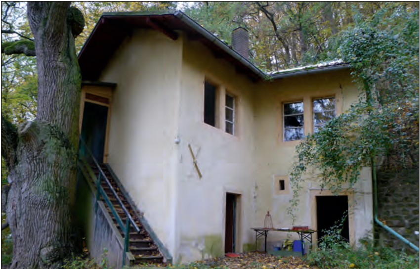
Abb. 4: Sommerhaus im Jahr 2012