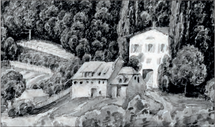
Abb. 1: Im Bildvordergrund unbekanntes Gebäude, dahinter das Hauptgebäude des Sommerkellers. Diese Darstellung dürfte vor 1826 entstanden sein, da das Sommerhaus nicht abgebildet ist.