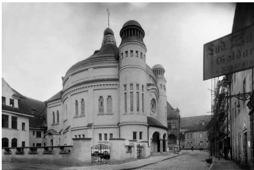
Abb. 2: Neue Synagoge 1912

Als Quellen verwendete Meyer neben den Werken verschiedener Historiker vor allem die Akten der Gemeinde und die Matrikelbücher des Rabbinats. Darüber hinaus benutzte er die Quellenbestände des Kreisarchivs in Amberg, die sich auf die Juden in Regensburg beziehen.