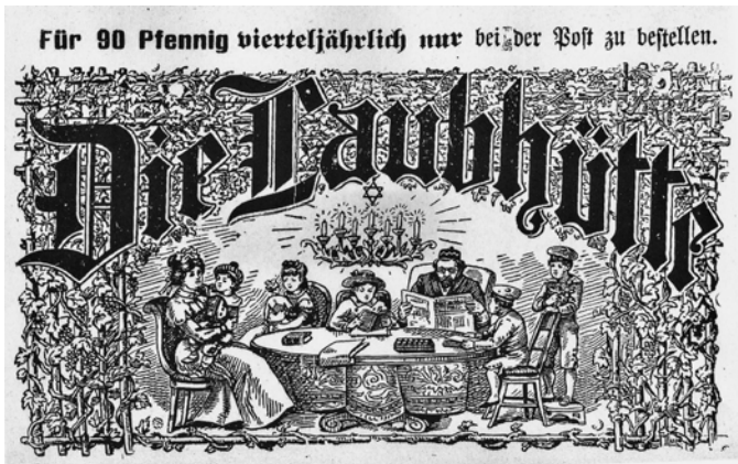
Abb. 5: Titelkopf „Die Laubhütte“ (Seligmann Meyer, Mysteriös , Anzeige)

in seinen Grundzügen, mit Änderungen und Ergänzungen über 100 Jahre, bis zum Ende des Königreichs 1919 bestand.