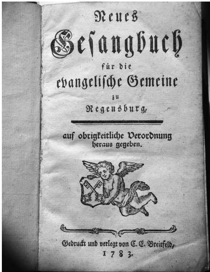
Abb. 4: Gesangbuch. ELKAR-NG 777