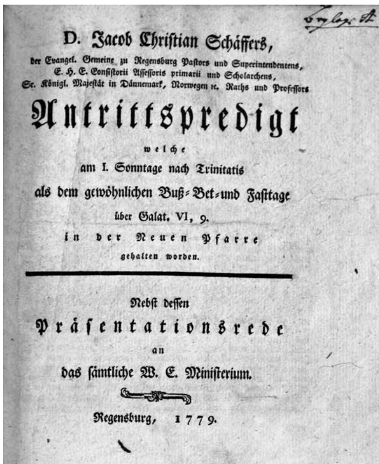
Abb. 2: Antrittspredigt. ELKAR 51

Außerdem bezeichnet Schäffer sich auf dem Titelblatt der gedruckten Predigt als Scholarch.