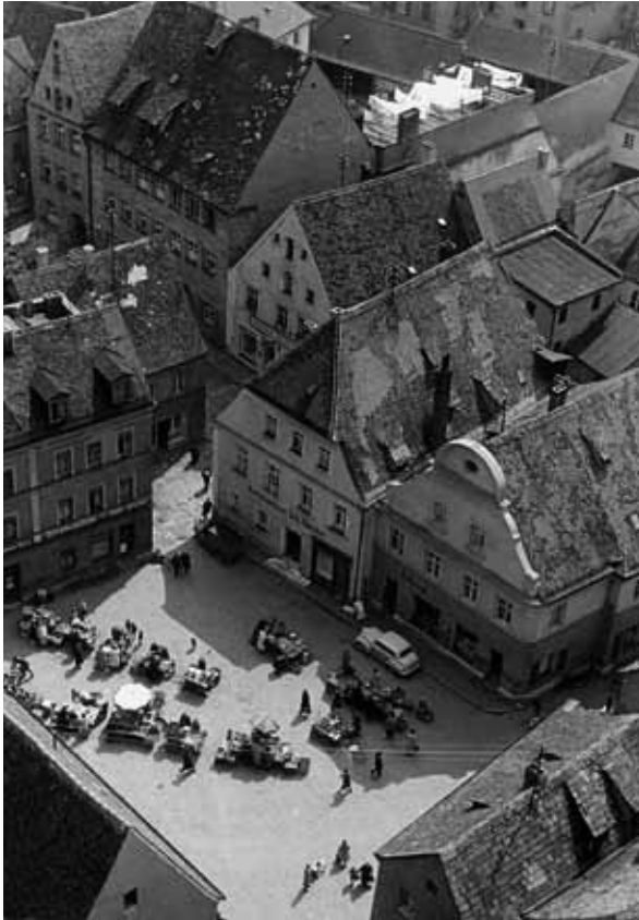
Abb. 8: Der Wochenmarkt fand offensichtlich schon in den 1930er Jahren teilweise auf dem Salzstadelplatz statt (Foto: Kurt Franke, Sammlung Georg Birner).

Nach der Währungsreform tauchten überall im Stadtgebiet „die seit Jahren vermißten Gemüsehändler“ auf, weshalb sich die Stadt entschloss, auf dem Salzstadelplatz einen Gemüsemarkt zu etablieren. Letzterer war dafür aber nicht nur wegen des heftigen Winds hinter der Martinskirche, sondern zudem wegen seiner geringen Größe völlig ungeeignet. Deshalb wurde angeregt, ihn auf den Paulanerplatz zu verlegen, „von wo er vor Jahren so plötzlich verschwand“. 314 1954 erfolgte eine Neufestlegung der Märkte. Dabei wurden der Viktualienmarkt vom Paulanerplatz in die Zeughausstraße „zwischen Feuerwehrhaus und Finanzamt“, heute zwischen der Stadtgalerie „Alte Feuerwache“ und dem Zeughaus, dem Landratsamt des Landkreises Amberg-Sulzbach, und der Ferkelmarkt auf den Paradeplatz verlegt. 315 Die Obsthändler verkauften entlang der Martinskirche, wo an Markttagen Parkverbot herrschte und ihre Standplätze markiert worden waren. 316