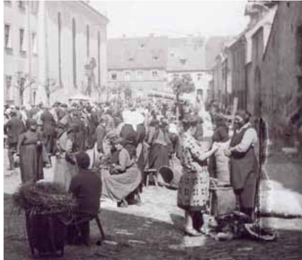
Abb. 9: Der auf den Paulanerplatz verlegte Wochenmarkt (Glasplatte

jedermann, der sich an die Marktordnung hielt, berechtigt, zum Verkauf auf den Markt zu kommen. 335