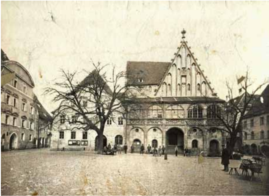
Abb. 1: Händler auf dem Marktplatz vor dem Rathaus vor dessen Umbau von 1880.

Ob Ludwig aber als „Stifter“ des Amberger Wochenmarkts anzusprechen ist, ist denkbar, doch wenig wahrscheinlich. Möglicherweise geht der Wochenmarkt bereits auf ein Privileg von Ludwigs Vater, Herzog Ludwig II., 20 zurück, der nach seiner Belehnung mit Amberg durch den Bamberger Bischof im Jahr 1269 21 dieser ein ebenfalls nicht erhaltenes Stadtrecht verlieh, von dessen Existenz nur die Stadtrechtsurkunde seines Sohnes Rudolf von 1294 kündigt. 22 Auch dadurch, dass gelegentlich