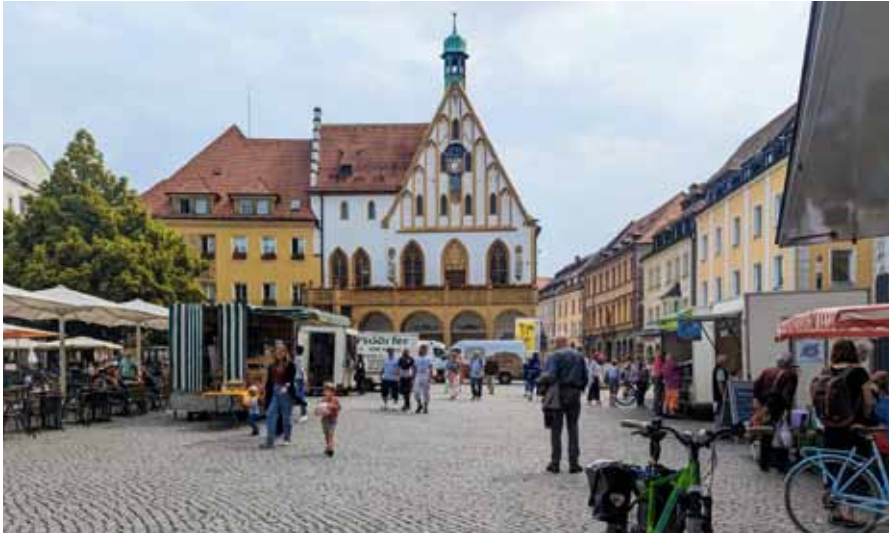
Abb. 10 und 11: Der Bauernmarkt auf dem Marktplatz.