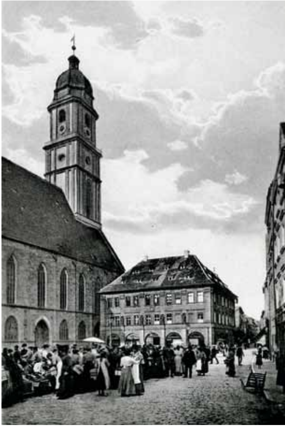
Abb. 6: Ansichtskarte des Marktplatzes mit Marktgeschehen, eingehamrt von der Martinskirche und der ehemaligen Ratstrink- stube, nach 1920.

Stadtmagistrat beispielsweise im Dezember 1828 jedermann den Verkauf von Unschlittkerzen und Seife auf dem Wochenmarkt. 247