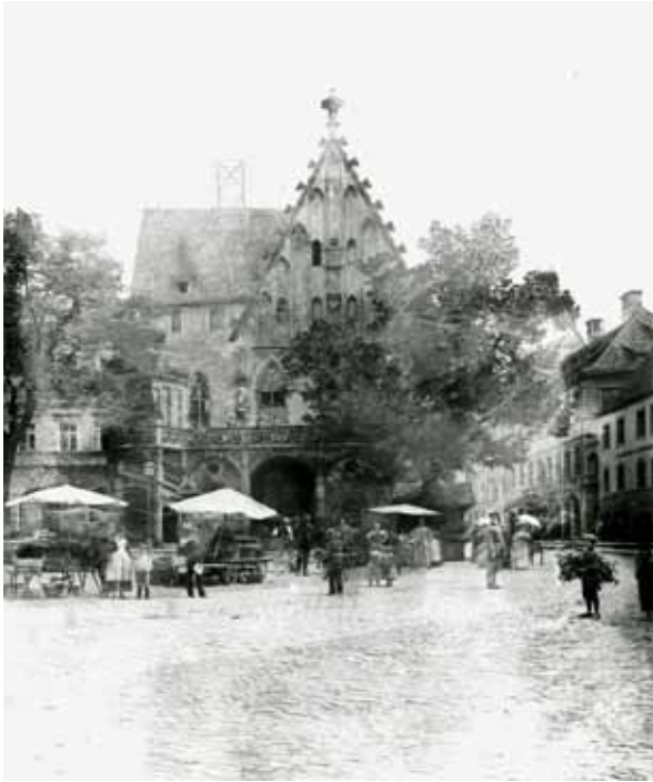
Abb. 2 und 3: Stände auf dem Markt- platz vor dem Rathaus nach dessen Umbau von 1880.

wochenmarkt“; 26 Markttag war in Nittenau Dienstag. Am 4. Februar 1375 folgte die Gewährung je eines Wochenmarkts mit „Amberger Recht“ an Kemnath, am 11. August 1398 an Pressath. 27