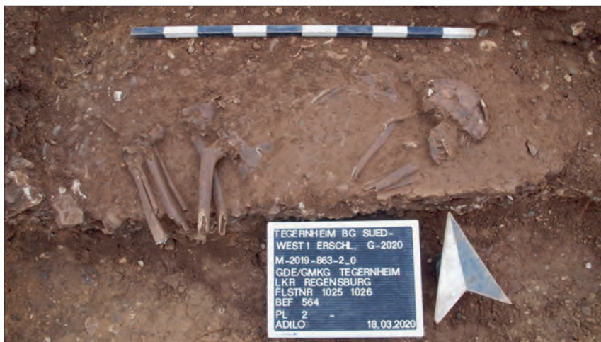
Abb. 8: Hockergrab Befund 564