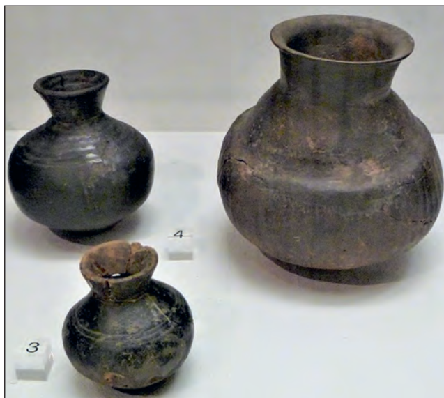
Abb. 5: Tegernheimer Funde (4) ausge- stellt im Histori- schen Museum Regensburg

1964 konnten erneut im Bereich des Fundortes von 1937/38 aus einer Kiesgrube urnenfelderzeitliche Tonscherben geborgen werden. 11