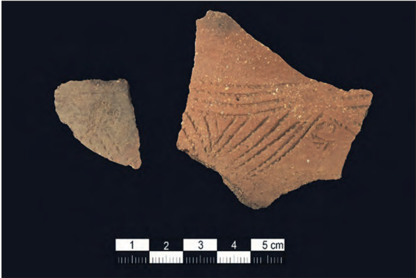
Abb. 12: Keramikscherben: Es gab auch Befunde, die sich nicht eindeutig einer bestimmten Zeit zuordnen ließen, unter anderem mehrere Keramikfragmente. Diese Keramikscherben scheinen in der Technik an die wesentlich ältere Stichbandkeramik (4.900–4.500 v. Chr.) zu erinnern. Die Ornamentik (Schmuckmotiv) selbst ist wohl nichtregionalen Einflüssen der Späten Bronzezeit zuzuschreiben. 24