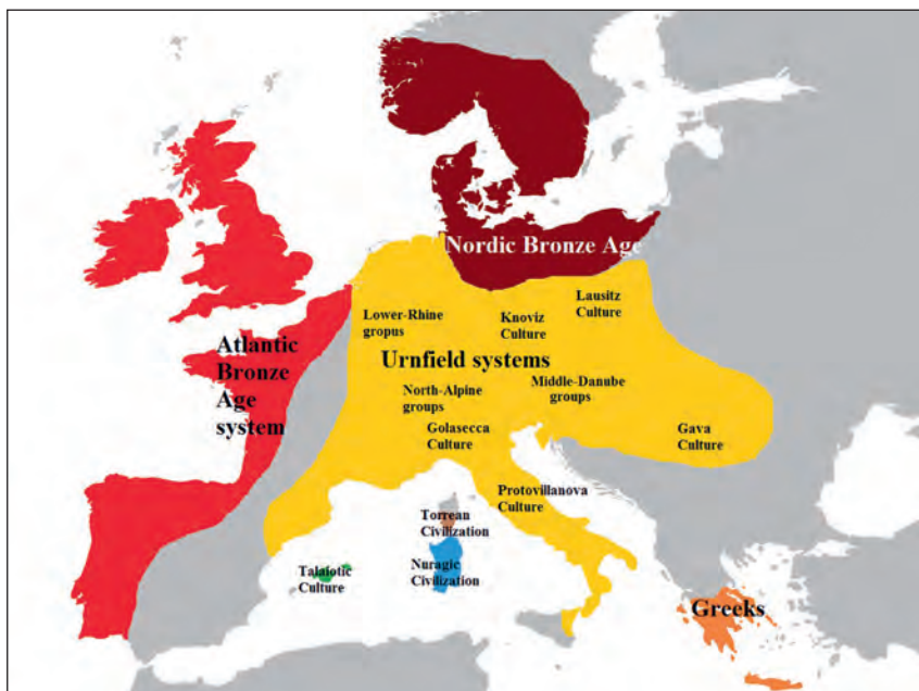
Abb. 10: Europa in der Spätbronzezeit, gelber Bereich verschiedene Urnenfelderkulturen

Kimmig). In Bayern dürften die Leute der Urnenfelderkultur eine frühe Form des „Keltischen“ gesprochen haben. 18