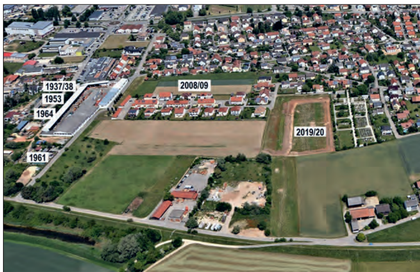
Abb. 6: Luftaufnahme von Tegernheim Süd-West, Juni 2019

In der Luftaufnahme sind die Fundorte und Grabungskampagnen mit Jahreszahlen angegeben. Als die Aufnahme entstand, fanden im Bereich der heutigen Anne-Frank-Straße gerade die ersten Oberbodenabtragungen statt. Nachfolgend der Aufnahme ist ein Grundriss des Baugebietes mit den untersuchten Flächen abgebildet.