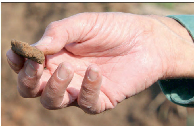
Abb. 2: ein archäologisches Fragment im Baugebiet Tegernheim Süd-West