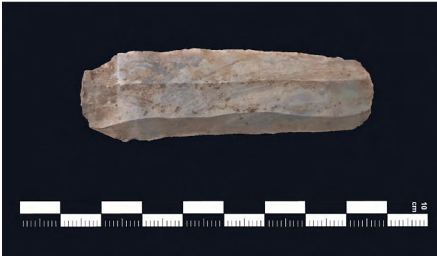
Abb. 13: Silexklinge (Feuersteinklinge), die bei der Freilegung des zweiten Hockergrabes entdeckt wurde 25