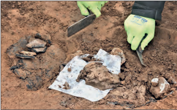
Abb. 4: Notgrabung, zer- scherbte Keramik bei den Grabungen im Baugebiet Süd-West, im Mai 2019

Die Lehrgrabung findet im Rahmen einer Lehrveranstaltung mit Studierenden statt, damit diese einen Einblick in die praktische Grabungstechnik erhalten. In der Regel ist die Teilnahme an einer Lehrgrabung im Laufe eines Studiums archäologischer Fächer Pflicht.