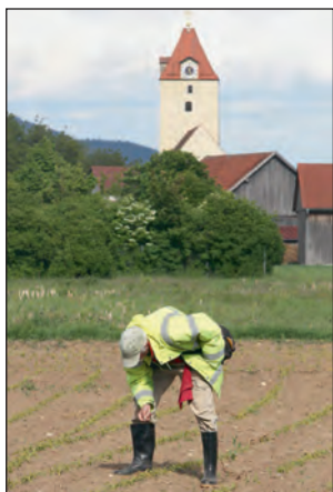
Abb. 1: Feldbegehung im Mai 2019

Das Wort Archäologie kommt aus dem Altgriechischen und bedeutet „Lehre von den Altertümern“. Sie befasst sich mit den materiellen Hinterlassenschaften des Menschen, wie Gebäuden, Werkzeugen, Keramiken und Kunstwerken. Sie umfasst den Zeitraum von den ersten Steinwerkzeugen vor etwa 2,5 Millionen Jahren bis in die nähere Gegenwart.