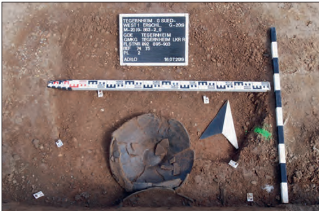
Abb. 11: Urne, die im unteren Bereich intakt ist

Am interessantesten sind sechs mögliche Überreste von Urnenbestattungen, die sich über das gesamte Gelände verteilen. Ein zentraler Ort für Bestattungen war nicht direkt erkennbar. Allerdings häuften sich derartige Befunde besonders an der Marie-Juchacz-Straße. Leider konnte ein Leichenbrand nicht mehr nachgewiesen werden. 22