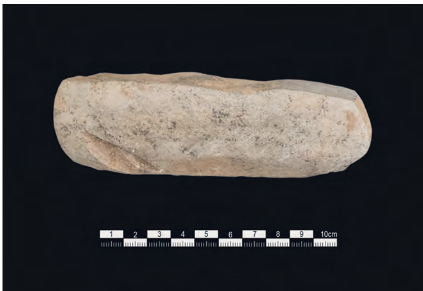
Abb. 9: Steinbeil