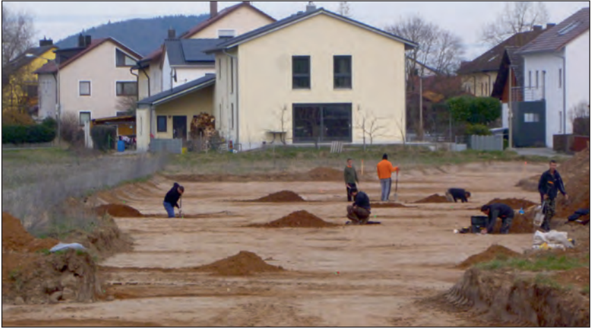
Abb. 4: Archäologische Arbeiten im Baugebiet Obere Felder II

Mit insgesamt 13 vergebenen Fundzetteln stellte die Keramik mit Abstand die größte Fundgattung dar. In den meisten Fällen waren die Funde datierbar und eine Einteilung in die Frühe Bronzezeit (2200-1600 v. Chr.) oder eine wahrscheinliche Einordnung in die Urnenfelderkultur (1300-800 v. Chr.) möglich. Näheres zur Urnenfelderkultur ist im Aufsatz „Tegernheims Vor- und Frühgeschichte“ nachzulesen.