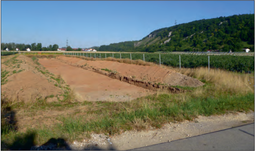
Abb. 3: Nördlicher bzw. vierter Sondagestreifen „Am Hohen Sand“ war befundfrei

vermutet. Deshalb mussten vor Baubeginn archäologische Untersuchungen vorgenommen werden. Diese begannen am 17. und endeten am 25. Juni 2020. Mit dem Oberbodenabtrag wurden vier Sondagestreifen in Ost-West-Ausrichtung angelegt (Abb. 3).