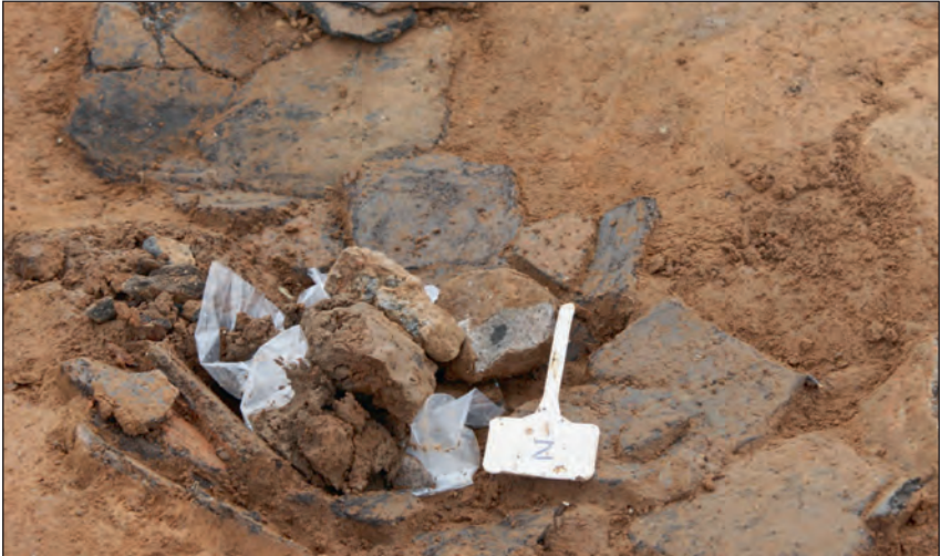
Abb. 2: Zerscherbte Keramik im Baugebiet Süd-West I