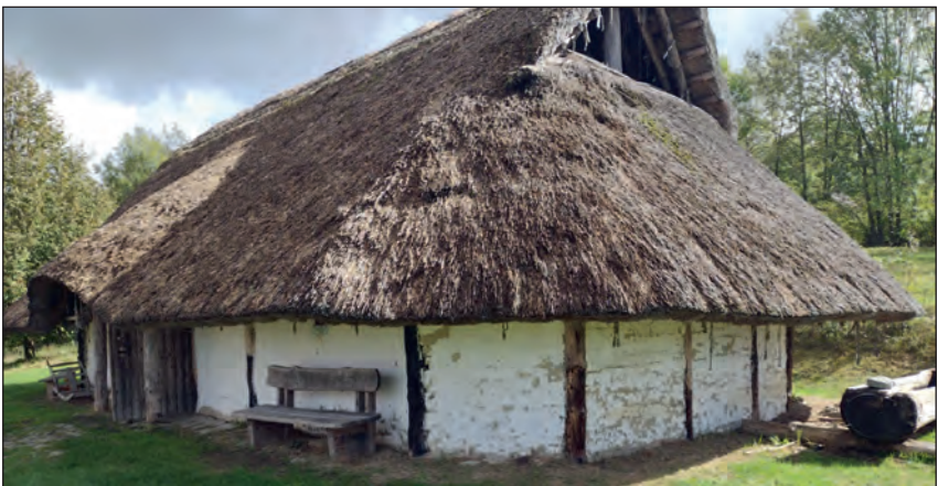
Abb. 6: Eine Rekonstruktion eines keltischen Herrenhauses nach Befunden in Köfering im Landkreis Regensburg. Das Haus stammt aus der Zeit des 4./3. Jahrhunderts v. Chr.