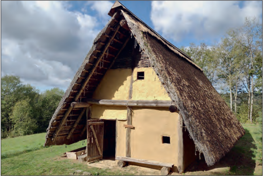
Abb. 5: Eine Rekonstruktion eines Töpferhauses aus der Zeit der Urnenfelderkultur (1300–800 v. Chr.) Es diente als Werkstätte für Töpferwaren. Das Haus ist ein Nachbau nach Befunden in Künzing im Landkreis Deggendorf.