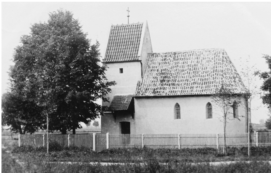
Kapelle in Hartham, um 1910.