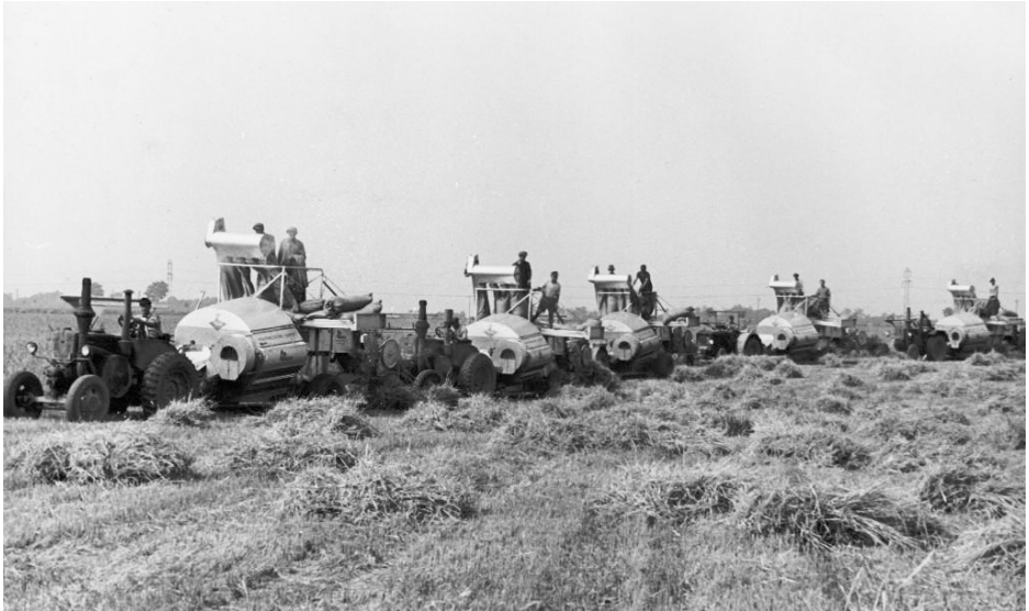
Neuzeitliche Landtechnik war auf allen Puricelli-Gütern selbstverständlich. Hier der Großeinsatz des gezogenen Mähdreschers Claas-Super auf Gut Aukofen, ca. 1958.