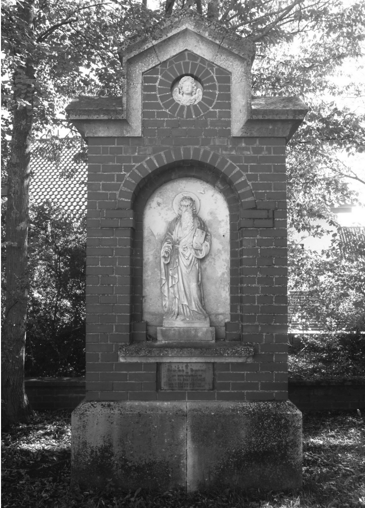
Das Paulusdenkmal in Harting, Neutraublinger Straße.