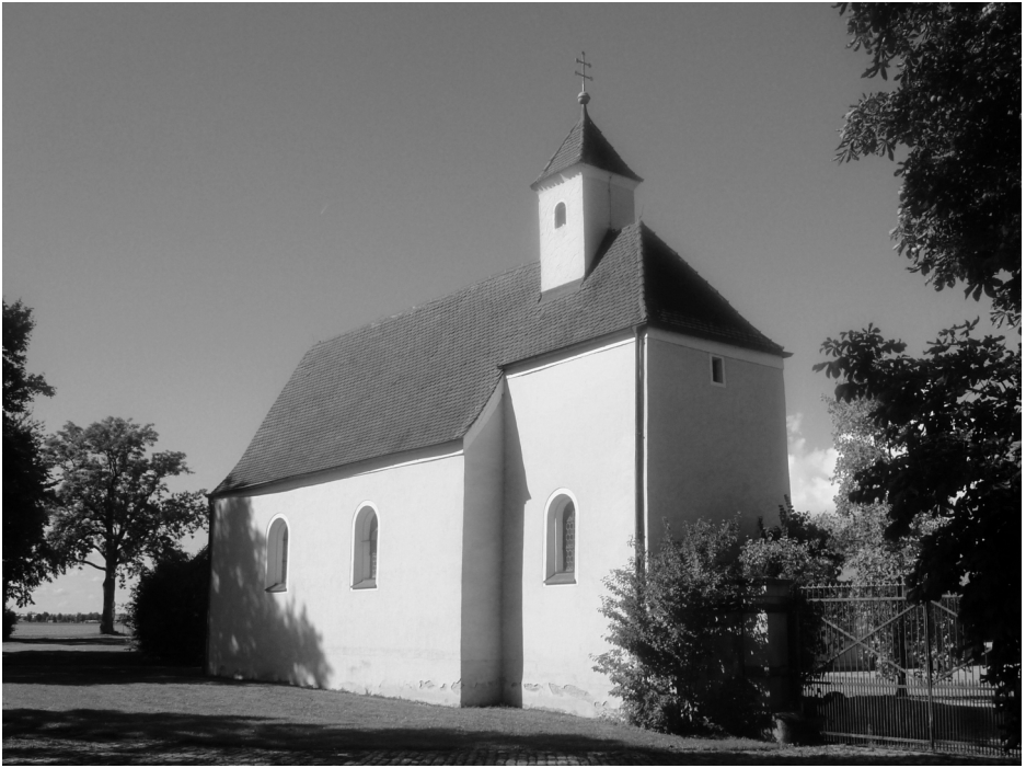
Kapelle am Gut Lerchenfeld.