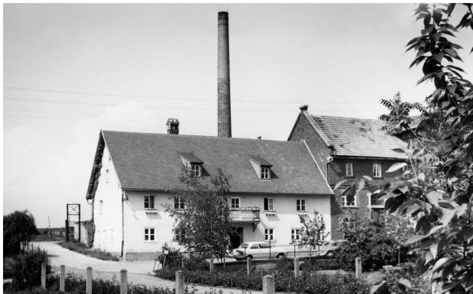
Das Gutshaus in Langenerling im Jahre 1965.