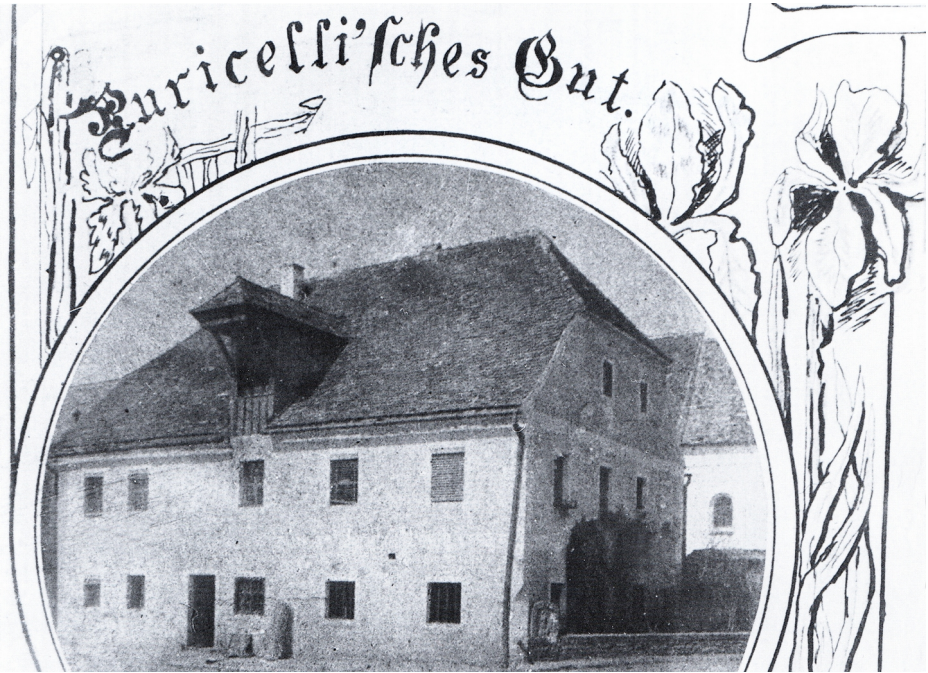
Das Gutshaus in Harting auf einer Postkarte um 1905.

Baumaßnahmen in der Anfangszeit nach dem Besitzerwechsel 1884 sind u. a. zu nennen: Wiederaufbau des abgebrannten Stadels und Verlängerung der Remise 1894, Neubau der Brennerei und des Paulusdenkmals 1895 sowie der Bau eines neuen Pächterhauses 1903 durch den in Moosham wohnhaften Baumeister De Gindici Leonardo, der dort ebenfalls für Puricelli tätig war. In der 1897 in Betrieb genommenen Brennerei durften bis zu 703 hl reiner Alkohol hergestellt werden.