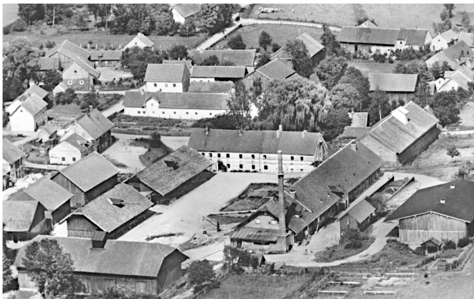
Gut Gailsbach, ca. 1950.