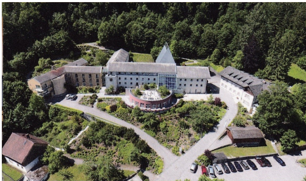
Das Haus heute