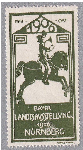
Reklamemarke der Ausstellung

Blickfang der Ausstellung war ein überdimensionierter Bleistift. Mit einer Höhe von 30 Metern und einem Umfang von 4 Meter überragte er das gesamte Gelände.