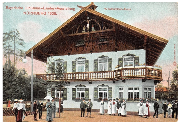
Ansichtskarte von der Landesausstellung in Nbg

Ausgestellt waren zum Beispiel ein typisches Haus aus dem Allgäu, eine Holzfällerrütte aus dem Bayerischen Wald und für das Werdenfelser Land ein für diese Gegend typisches Gebirgshaus, das heutige „Haus Werdenfels“.