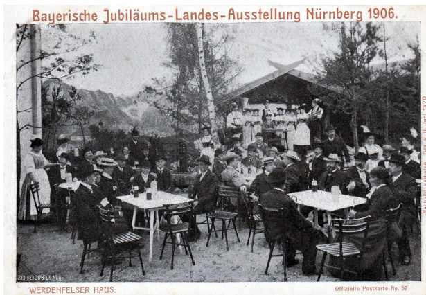
Der Biergarten des Werdenfelsers Hauses in Nürnberg