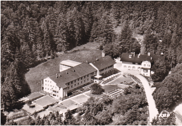
Postkarte „Haus Werdenfels“ um 1960

Das Wohl der Gäste, die Möglichkeit zur inneren Einkehr und zur Ruhe zu kommen ist die oberste Maxime des Hauses. Die bis zu 20.000 Übernachtungen im Jahr bestätigen das erfolgreiche Konzept der Mällersdorfer Schwestern die den Geist des Hauses von Beginn an wesentlich geprägt haben.