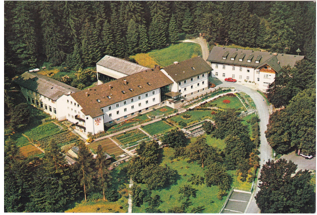
Ansichtskarte um 1970