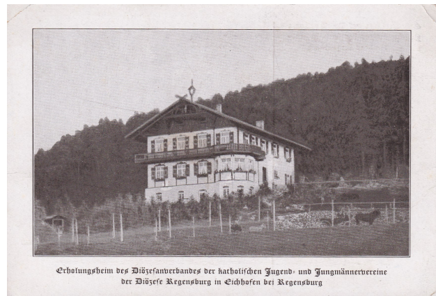
Postkarte „Haus Werdenfels“ im Labertal um 1930