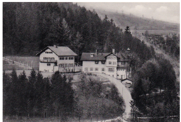
Gesamtansicht um 1940

Um das Kursangebot erweitern zu können errichtete man 1953 ein neues Hauptgebäude. Zusätzlich wurde im ursprünglichen Haus eine Hauswirtschaftsschule mit Unterrichtsräumen und Internat für bis zu 50 Mädchen eröffnet. Die Schule bestand bis in die siebziger Jahre.