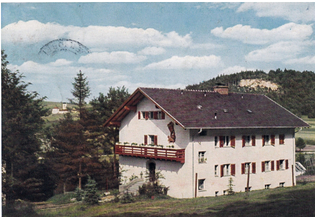
Fotopostkarte Neubau „Haus St. Michael“ von 1939

Unter der Führung der Mallersdorfer Schwestern, die bereits vor und während des Krieges hier tätig waren, kam es zu größeren Erweiterungen mit zusätzlichen Gebäuden.